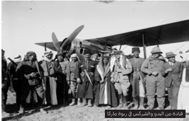
قيادة من الجنود والفرانسيس في رهوة ماركا

First plane landing witnessed by residents of Amman.