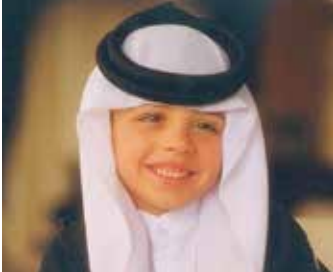
The birth of His Highness ميلاد سمو ولي العهد الأمير الحسين بن عبدالله الثاني the Crown Prince, Hussein bin Abdullah II