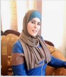
الدكتورة شاهر العمرو

أستاذ العلوم السياسية في جامعة الشرق الأوسط، باحث وكاتب سياسي ومختص في الشأن العُماني، رئيس قسم التربية الوطنية في كلية الخوارزمي الجامعية، عضو في جمعية العلوم السياسية، كاتب سياسي مُعتمد في عدة مواقع اخباريه له العديد من المؤلفات.